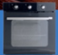
Hornos de empotrar calentadores eléctricos y hornos de inducción

Registra tu compra a través de WhatsApp UTE 098 1930 00 o en ute.com.uy