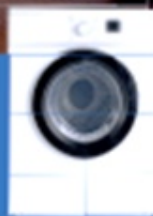
Secarropas o Lavadoras frontales