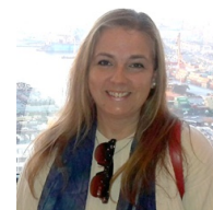
Por Anailén Nassif Gopar

Esteban Vieta: “Venimos muy bien encaminados y confiamos en que Milagros llegue en tiempo y forma”