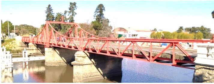
CRONOGRAMA DE EVENTOS - CARMELO 210 AÑOS