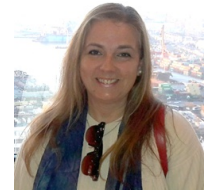
Por Anailén Nassif Gopar