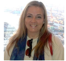
Por Anailén Nassif Gopar