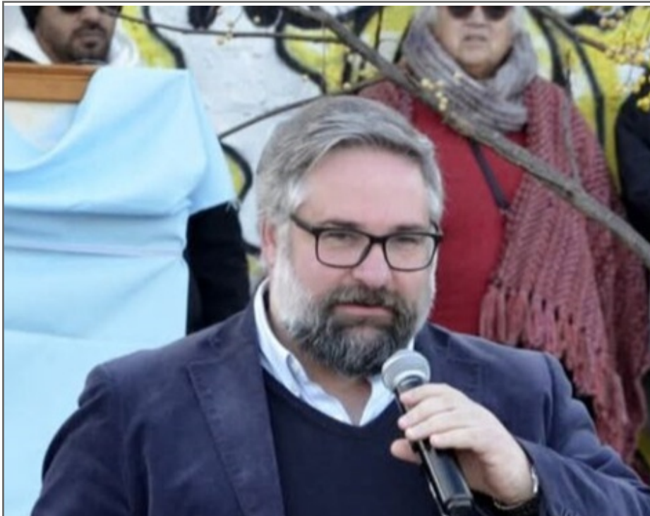
Por Anailén Nassif Gopar

Publicaciones Colonia el ejemplar $40 y mensual $500