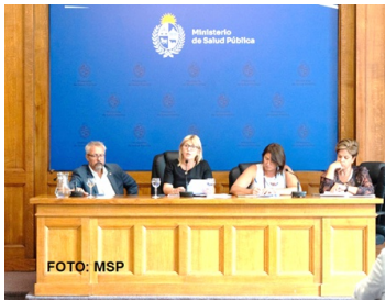
Tras la reciente presentación de la Política y Plan Integral Nacional de Garantías y Acceso Oportuno a la Salud, el Ministerio de Salud Pública (MSP) avanza en una reforma estructural que busca eliminar las esperas prolongadas en el sistema

sanitario. La iniciativa transforma el enfoque administrativo tradicional en una garantía efectiva del derecho a la salud, estableciendo que el tiempo de atención es un determinante clínico crucial. Nuevos estándares obligatorios Como eje central de esta política, el Poder Ejecutivo firmó el Decreto Marco de Plazos Máximos de Acceso, que regula a todos los prestadores públicos y privados bajo los siguientes estándares: