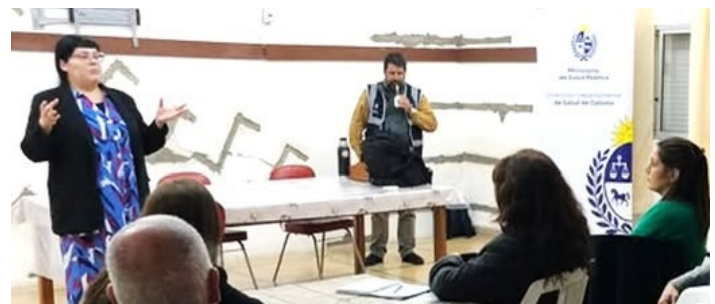
La jornada comunitaria logró reunir a un grupo de vecinos, representantes de diversas instituciones y múltiples actores sociales del medio. El propósito central del encuentro consistió en propiciar un espacio de diálogo para intercambiar ideas, identificar necesidades específicas y plantear propuestas concretas directamente vinculadas al bienestar general y a la salud mental en la comunidad local.